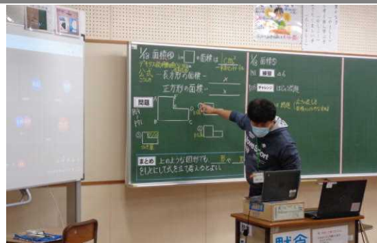
4年生：算数、国語「故郷の職を伝えよう」ではリーフレット作成等も行っている。