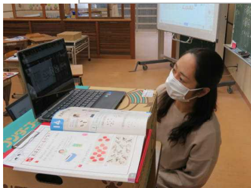
1年生：算数、国語や音楽も授業実施。ほぼ毎日全員参加