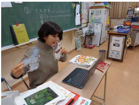
2年生：国語、算数など具体的な教具を作成し授業実施。