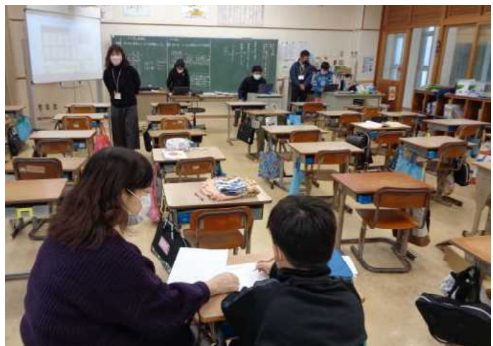
3年生：国語「百人一首」の授業、自主出校の児童支援にあたる本校職員(学習支援員、教務)